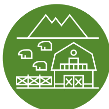
Для об'єктів сільського господарства