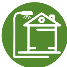
Для прибудинкової території