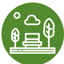
Для парків і пішохідних зон