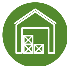
Для складських приміщень