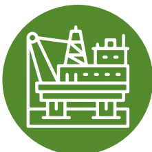
Для пром- майданчиків