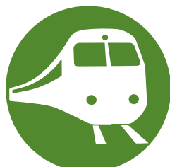
Для залізничних станцій і метро